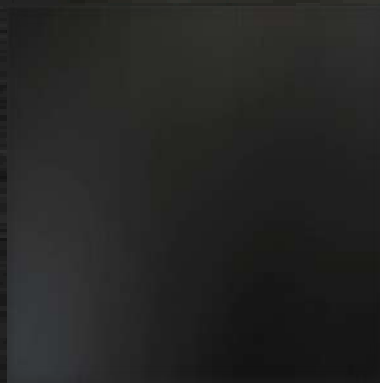
35. MR Black