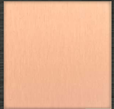
45. ST Velvet