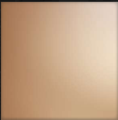
34. MR Bronze