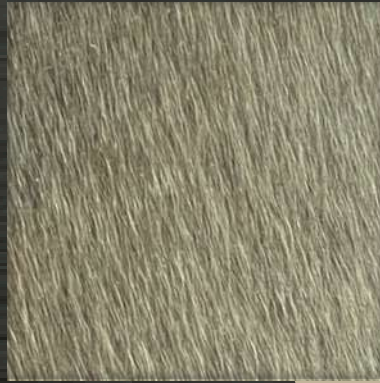
17. VIB White Gold