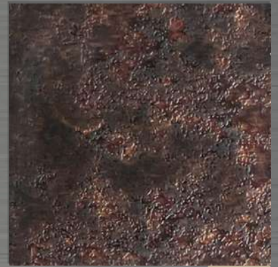
3. ETC Copper 1