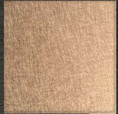
18. VIB Rose Gold