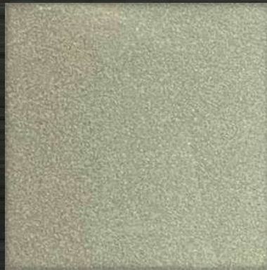
20. BB White Gold