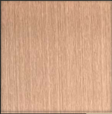
25. HL Bronze