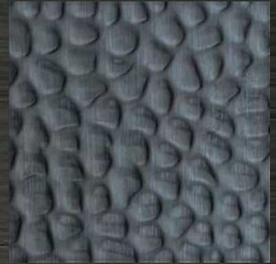
42. HM Black