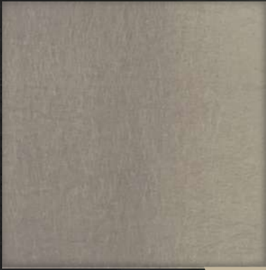
40. VIB Nickle Silver (L)