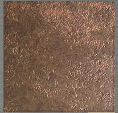
6. ETC Copper 2