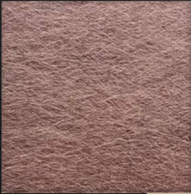
28. VIB Bronze