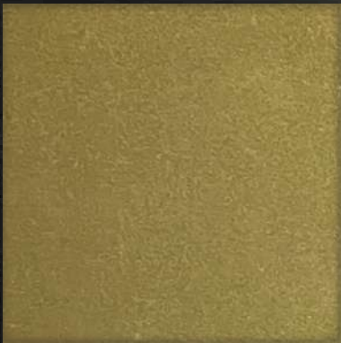
19. BB Gold