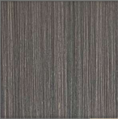
4. HL AT Copper *