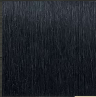
26. HL Black