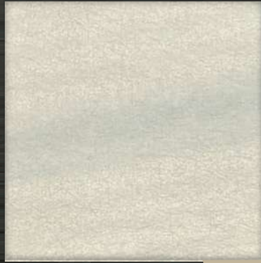
41. VIB Silver