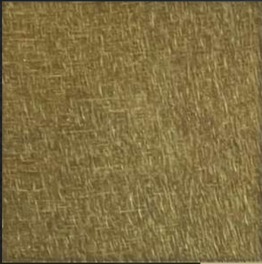
16. VIB Gold