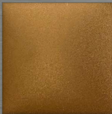
53. BB Rose Nickel