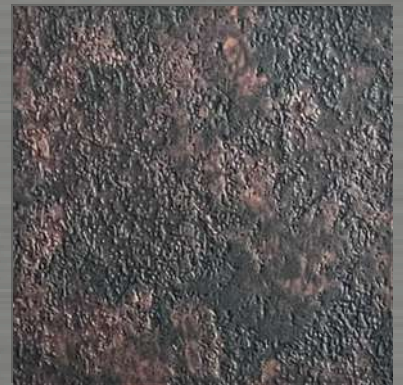
12. ETC Copper 4