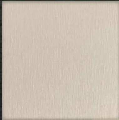
44. ST Ash Blonde