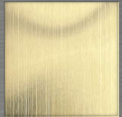
51. HL White Gold