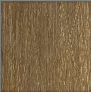
8. VIB AT Bronze *