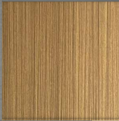
2. HL AT Bronze (D)