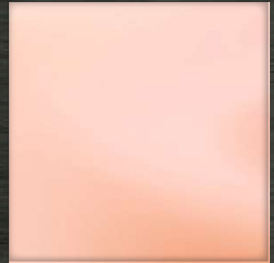
24. MR Rose Gold

สีอาจมีคลาดเคลื่อนเล็กน้อยในแต่ละล็อตที่ประมาณ +/- 3-5% (จากปัจจัยที่ไม่สามารถควบคุมได้จากกระบวนการผลิต)