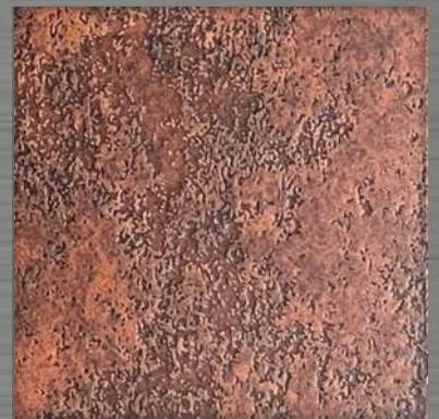
9. ETC Copper 3