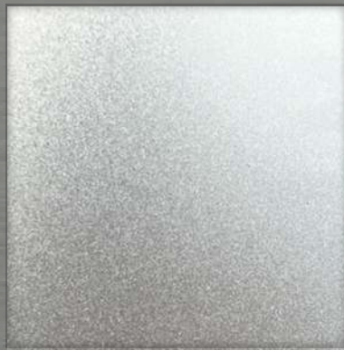
50. BB Silver