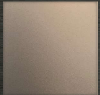
48. SL Bronze