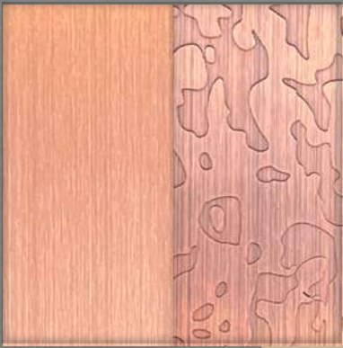
1. HL Copper*/ ET Copper*