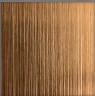
52. HL Rose Nickel