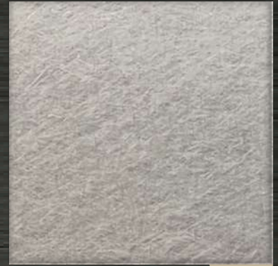
30. VIB Nickle Silver