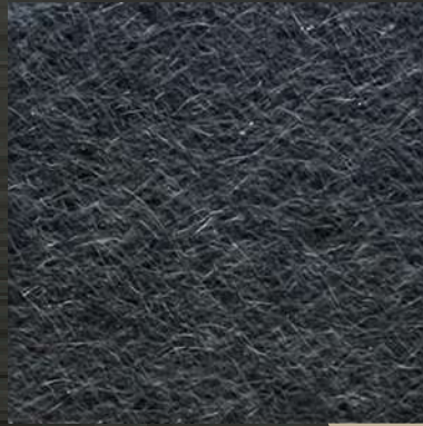
29. VIB Black