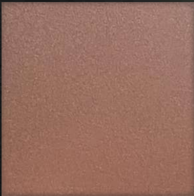
31. BB Bronze