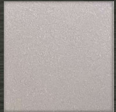
33. BB Nickle Silver