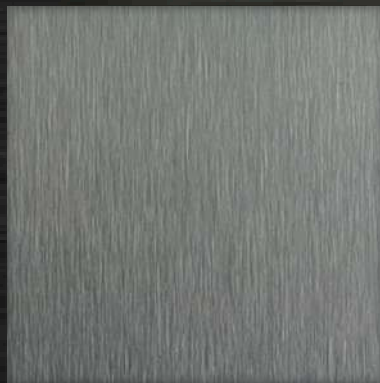
47. ST Grey