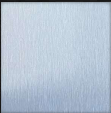
46. ST Silver Blue