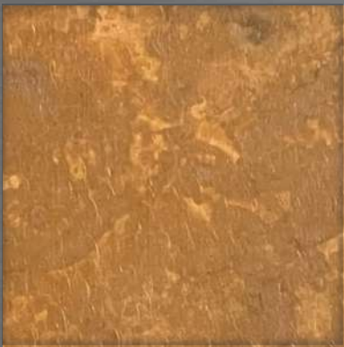
10. P-ANT-01 *