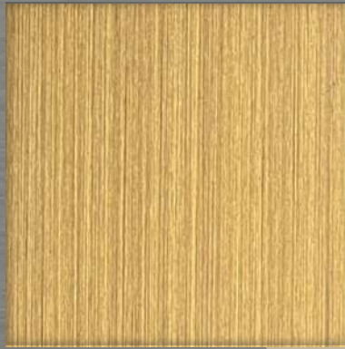
5. HL AT Bronze (L)