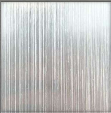
49. HL Silver