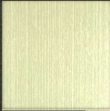
14. HL White Gold