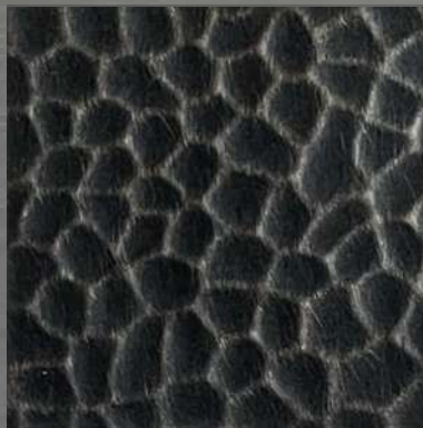
11. HM Bronze *