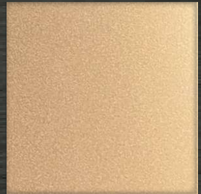
21. BB Rose Gold