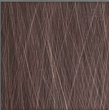
7. VIB AT Copper *