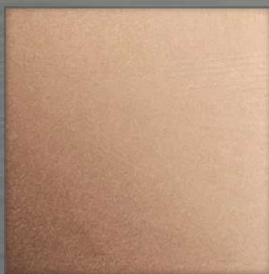
56. BB Bronze