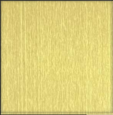
13. HL Gold