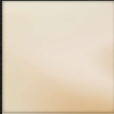
23. MR White Gold