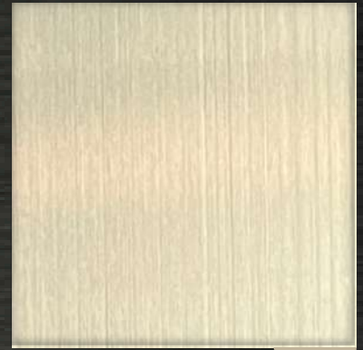
27. HL Nickle Silver