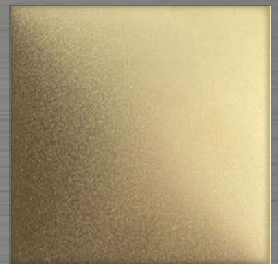
54. BB White Gold