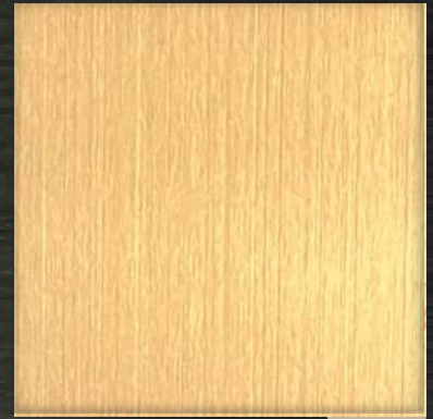
15. HL Rose Gold