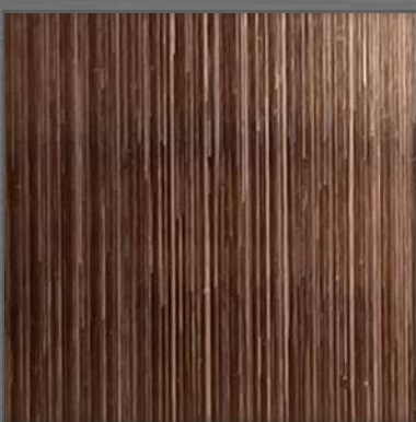
55. HL Bronze